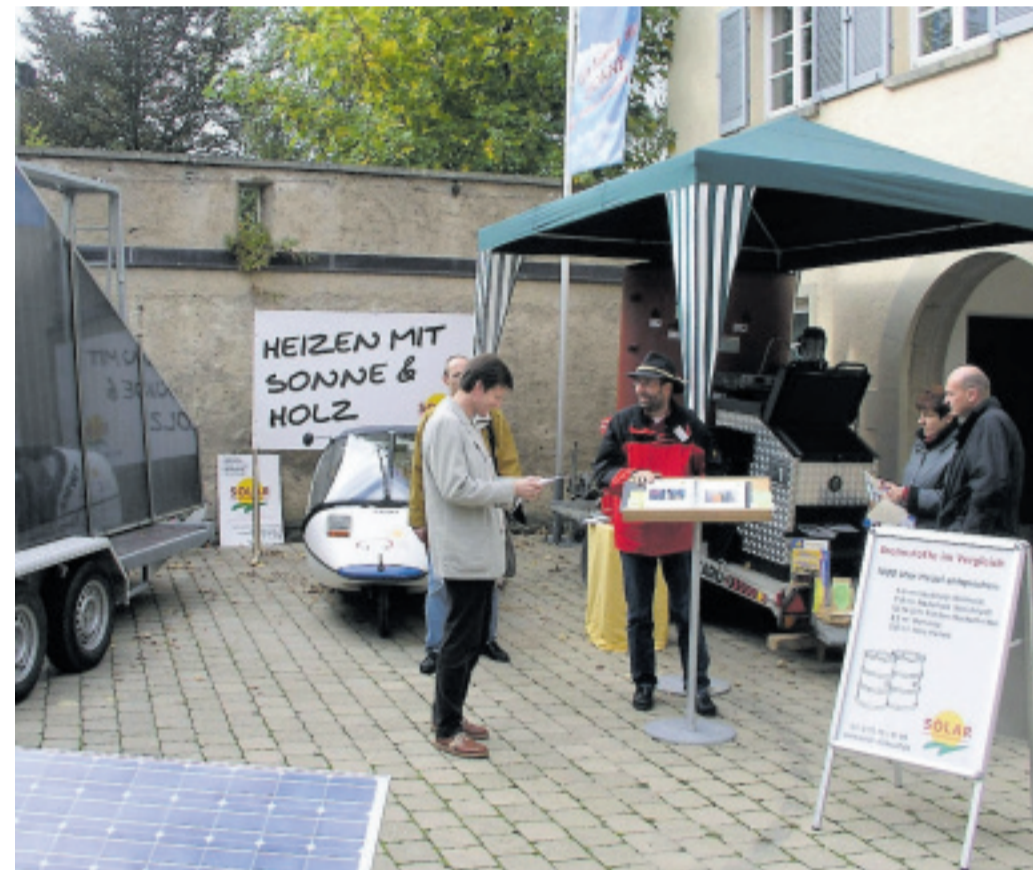
Am Samstag und Sonntag finden auf dem Gelände der Hochschule für Forstwirtschaft die Rottenburger Sonnen- und Holz-Energietage statt. Archivbilder